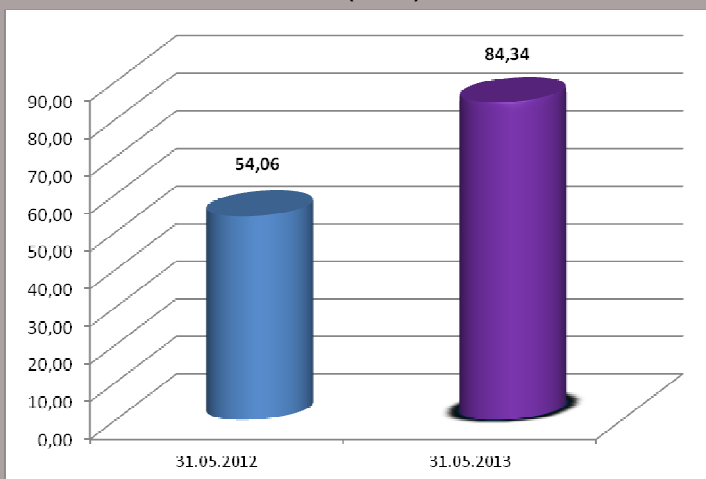
Profit realizat de SIF Oltenia SA (mil.lei)

În Adunarea Generală Ordinară a Acționarilor S.I.F. Oltenia S.A. din 20.04.2013 a fost aprobat un dividend brut de 0,13 lei pentru o acțiune deținută la data de înregistrare.